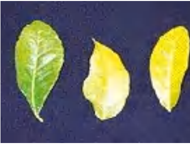
نقص النيتروجين في الموالح