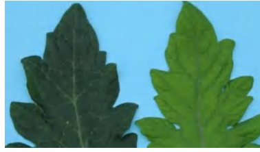
نقص النيتروجين في الطماطم