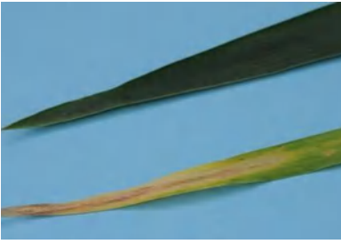
نقص النيتروجين في القمح