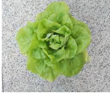
نقص النيتروجين في الخس