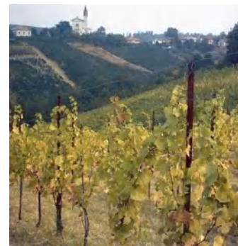
نقص النيتروجين في العنب