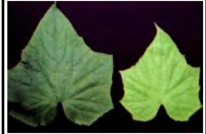
نقص النيتروجين في الخيار