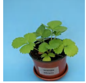
نقص النيتروجين في الفراولة