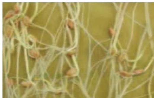
معاملة ديفيند اكستريم