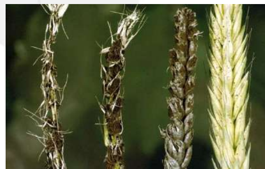
التفحم السائب بالقمح