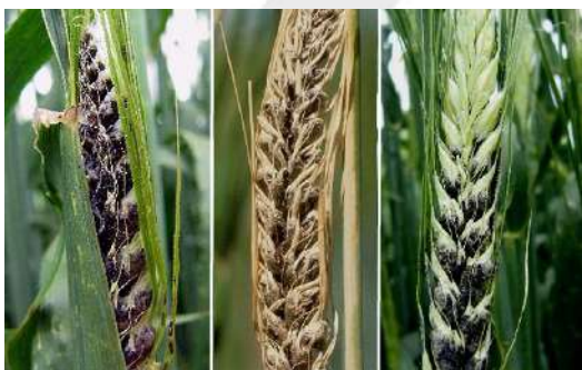
التفحم المغطي بالقمح