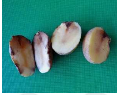
بكتيريا العفن الطري في البطاطس