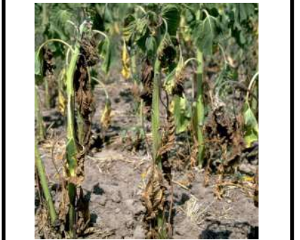
ذبول الفيرتسيليوم في الطماطم