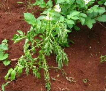
الذبول البكتيري في البطاطس