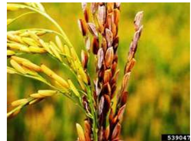
عفن الحبوب البكتيري