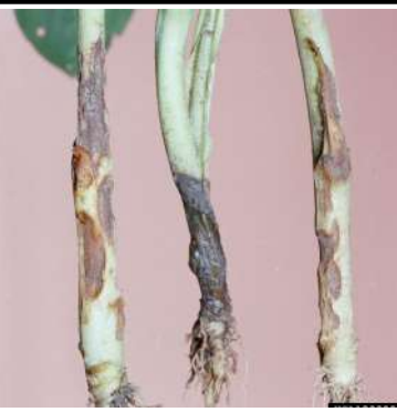
مرض ذبول البادرات