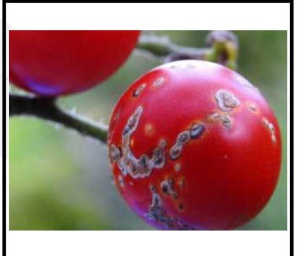
بكتيريا التقرح في الطماطم