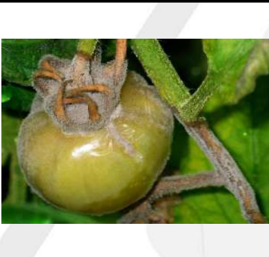
العفن الرمادي في الطماطم