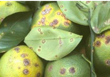
بكتيريا تقرح الحمضيات