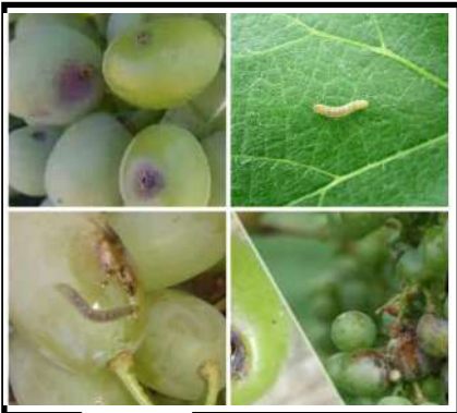
فراشة ثمار العنب