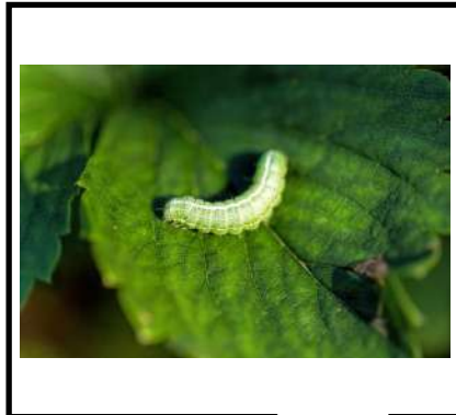
دودة ورق القطن