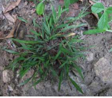
حشيشة ابو ركبة