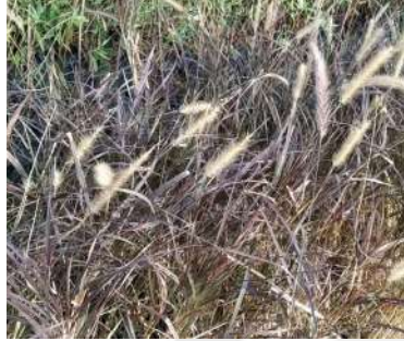
حشيشة ذيل القط